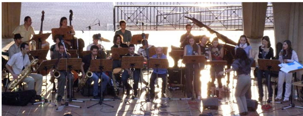
L'Orchestra del Conservatorio Licinio Refice

Il presente progetto di servizio civile si inserisce nel contesto dell'Istituto di Alta Formazione Artistica Musicale, Conservatorio Licinio Refice di Frosinone . Il servizio che vedrà realizzate le attività del progetto è la Biblioteca del Conservatorio.